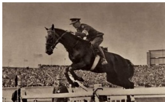
František Ventura a Eliot v Amsterdamu