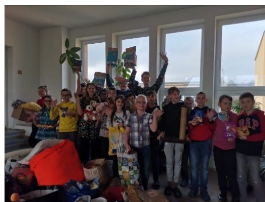
Dary pro útulky

zpráva naopak je, že řada stávajících obyvatel našla svůj nový domov, což je pro nás úplně to nejdůležitější. O všech adoptovaných kočičkách se můžete dozvědět na stránce http://www.mikeshb.cz/ .“