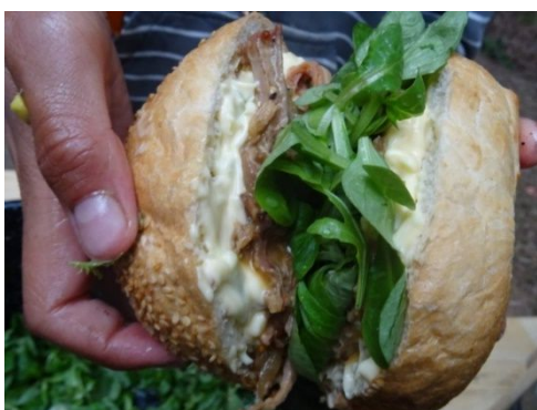
Na táborech je opravdu dobré jídlo

Skaut byl založen roku 1907 britským vysloužilým vojenským generálem Robertem Badenem Powellem, jakožto způsob jak naučit mládež disciplíně a více je spřáhnout s přírodou. První skautský tábor se uskutečnil hned roku 1907. V Čechách byl skaut založen později, až roku 1911, Antonínem Benjaminem Svojsíkem. Avšak organizace se u nás nejmenovala Skaut, nýbrž Junák, celým názvem Junák český skaut. Už bylo dost dějepisu, teď něco o Junáku dnes. Spousty měst má nějaká junácká střediska, větší města jich mají více, menší méně. Konkrétně Pelhřimov