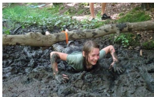
Ale není to pro žádné slečinky

si na začátku roku vymyslí své jméno a pokřik. Co se týče stereotypu, že skauting je nudný