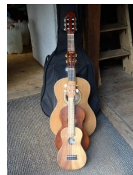
Hudba nesmí chybět

kroužek, ve kterém se budete učit vázat uzle venku v sadu, se toho moc říci nedá. Každá družina to totiž má jinak, některé se více zaměřují na učení a jiné zase na hraní her. Skaut každoročně pořádá i dva tábory, týdenní pro mladší a pro starší dvou až třítýdenní. A nejen to, každý rok se pořádá několik výprav. Ve výsledku je skaut plný dobrodružství, spousty her, příučení se nemálo užitečných věcí, ale především tu jde o kamarádství.